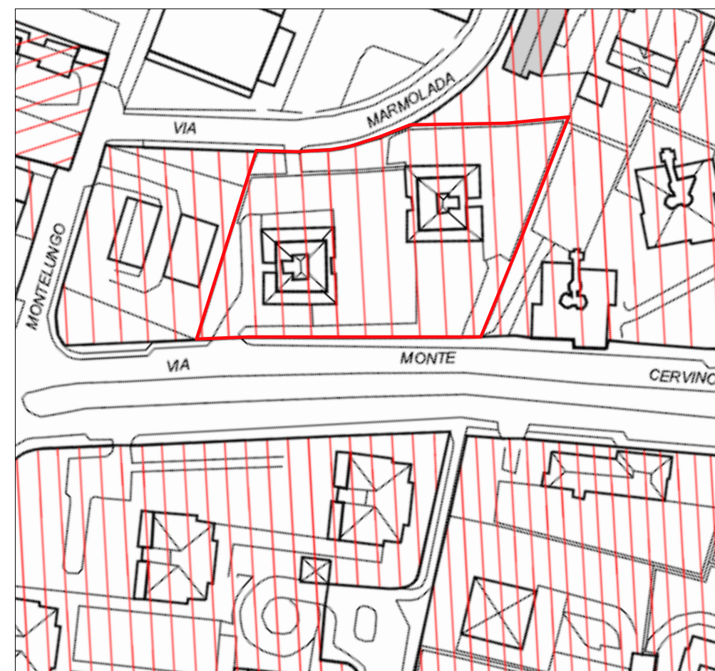
Piano delle regole: zona B2